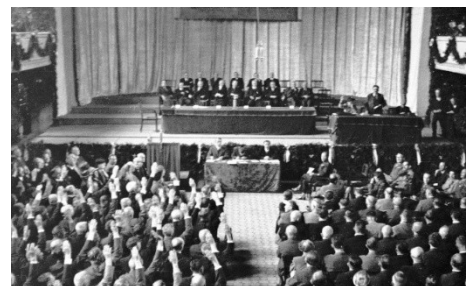
Bild 2: Hier stimmen die Politikerinnen und Politiker über die neue Verfassung ab.